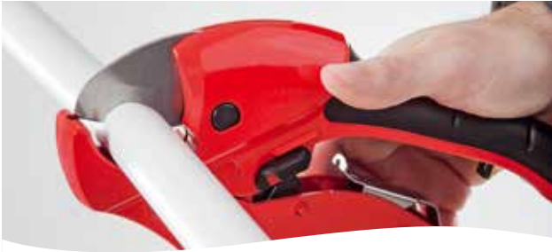
1. Rohr ablängen