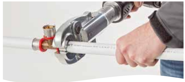
4. Verpressen – fertig