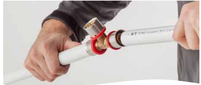
2. In Verbinder einstecken