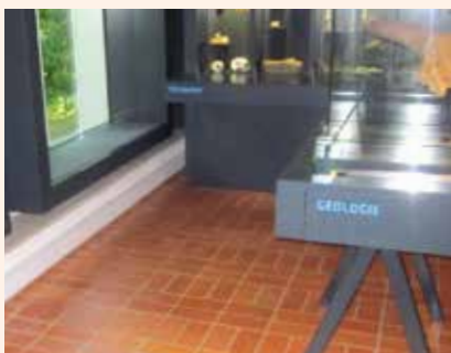
Museen und Kirchen