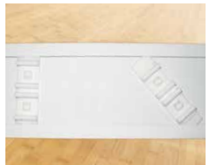
Fixierung Kunststoffhalter an der Blende