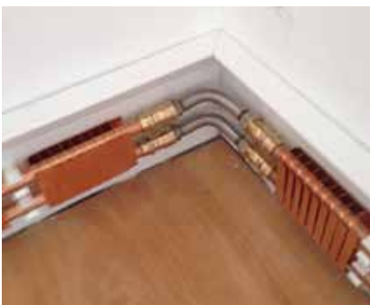
Eckausführung mit Umlenk-Kompensator