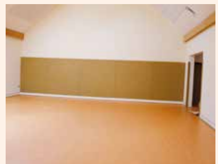
Sport- und Mehrzweckhallen